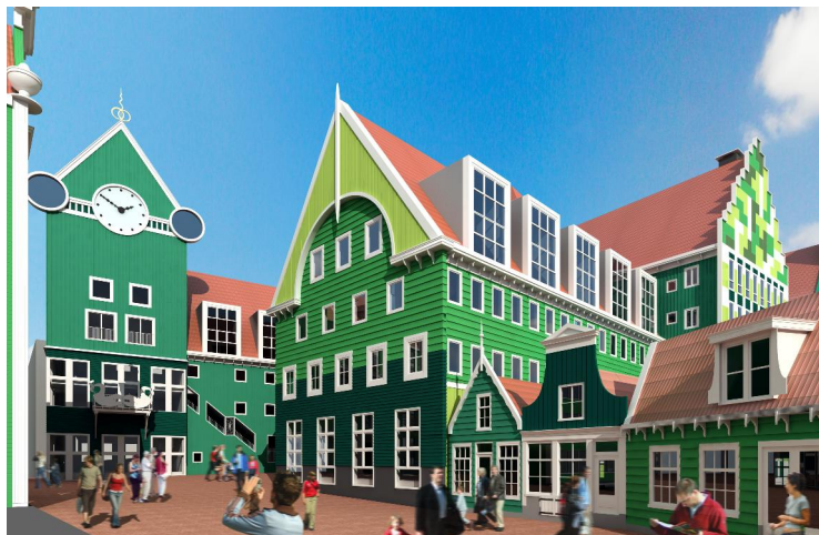
Stadhuis (deze afbeelding betreft een indicatie van de locatie)