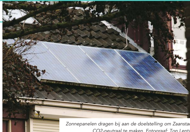
Zonnepanelen dragen bij aan de doelstelling om Zaanstad CO2-neutraal te maken.

De Ruimtelijke Milieuvisie ligt van 2 april tot en met 14 mei 2009 ter inzage bij de receptie gemeentehuis, de publieksbalie in Railpoint Office, de secretarie Noord en via www.zaanstad.nl . Tijdens deze inzageperiode kan iedereen zienswijzen op de ruimtelijke milieuvisie indienen. De schriftelijke zienswijzen moeten