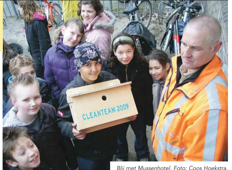
Blij met Mussenhotel.