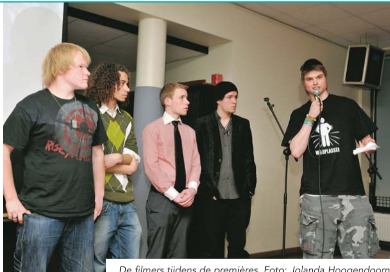
De filmers tijdens de première.

De film maakt in een half uur een toer langs de verschillende plek-