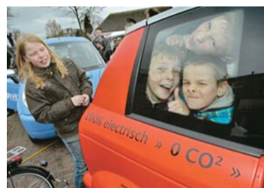
Leerlingen van de Toermalijn 'proberen' de Th!nk.

Marktbezoekers konden een elektrische scooter, brommer of step proberen. Ook werd de Th!nk, een betaal-