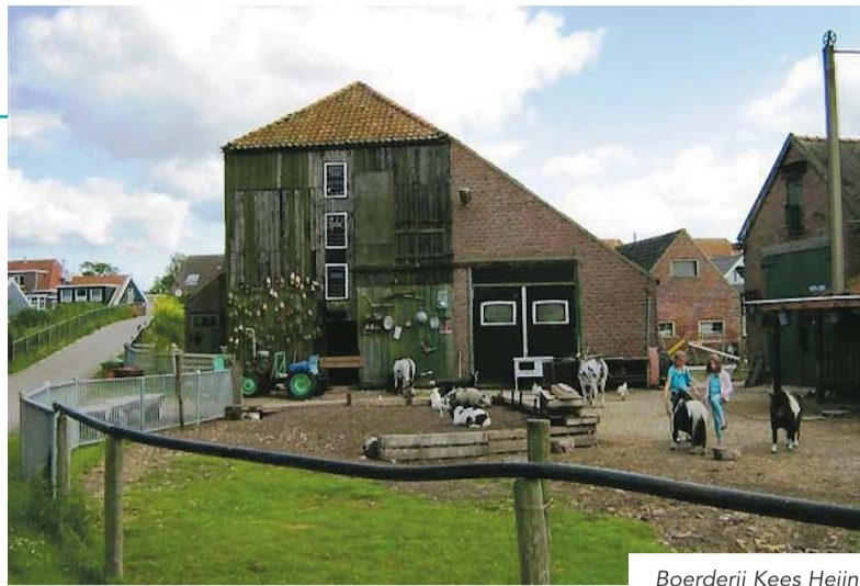
Boerderij Kees Heijn.

Iedere vogelliefhebber is welkom op donderdagavond 2 juli om 21.00 uur (tot ongeveer 22:00 uur). Goed weer is wel een vereiste, want bij slechte weersomstandigheden trekken de gierzwaluwen zich terug en is er helaas weinig te zien.