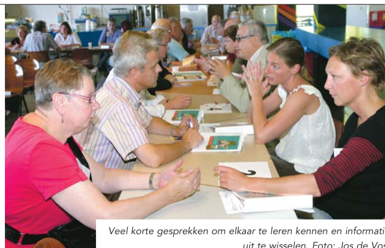
Veel korte gesprekken om elkaar te leren kennen en informatie uit te wisselen.

Het Zaanse minimabeleid, inclusief alle daarbij horende regelingen, wordt jaarlijks opgenomen in de brochure 'Het ABC van de gemeentelijke minimavoorzieningen'. Zaankanters met een minimum inkomen die in de gemeentelijke