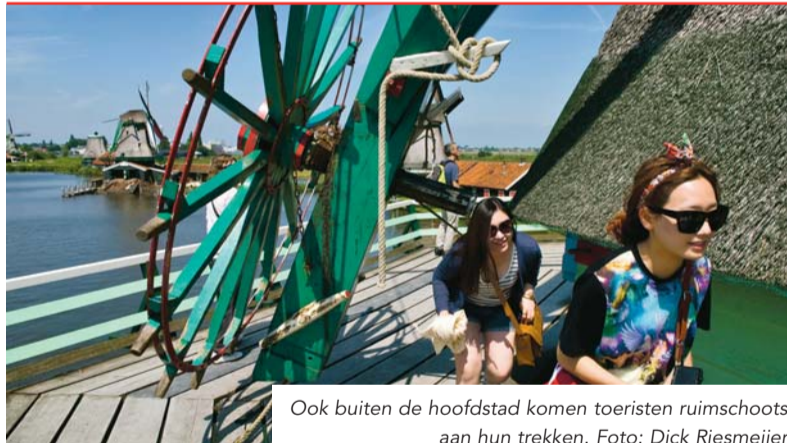
Ook buiten de hoofdstad komen toeristen ruimschoots aan hun trekken.

Bij slecht weer kun je vanachter de computer de webcams in onze streek opzoeken om live mee te maken wat op die plekken gebeurt. Bij mooi weer stappen veel inwoners en toeristen graag op de fiets. Sinds 1 juli kunt u de HollandRoute volgen. Deze route voert onder meer langs erfgoedlocaties die nauw verbonden zijn met het Noordzeekanaalgebied of de Zaan.