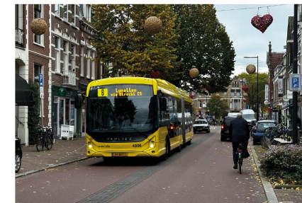
Referentie fietsstraat met bussen Nachtegaalstraat Utrecht